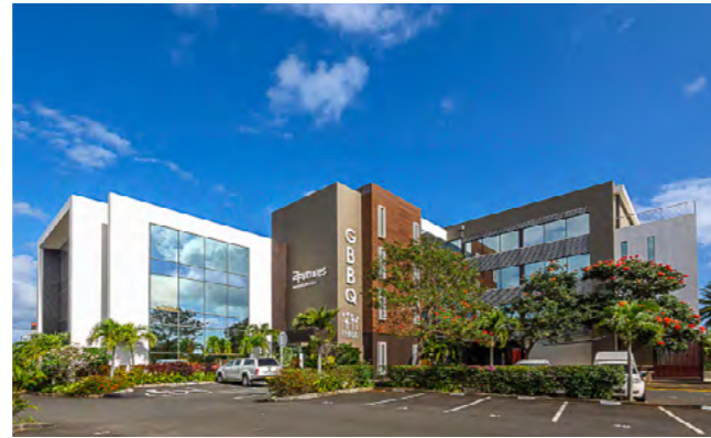
GRAND BAIE BUSINESS QUARTER