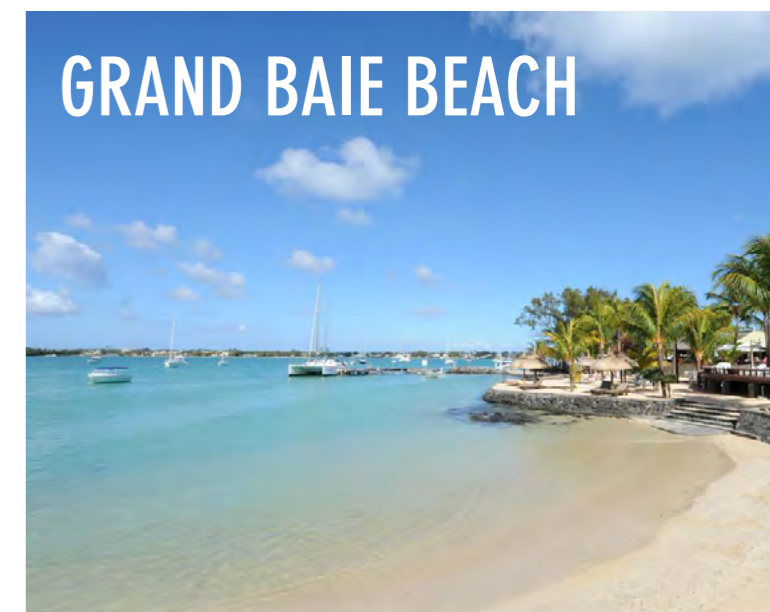
GRAND BAIE BEACH