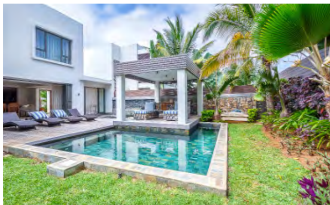
AO RÉSIDENCE DE LUXE