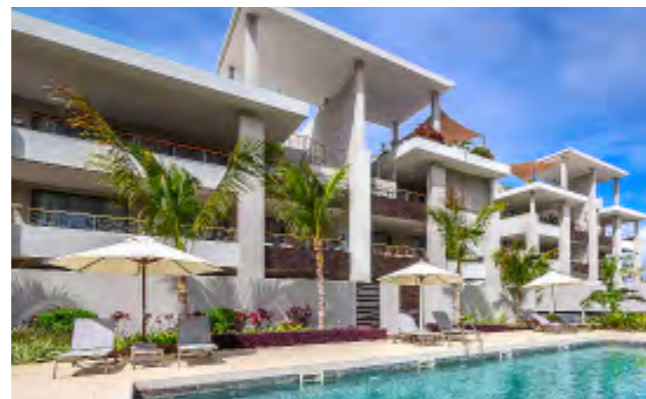
ELEMENT BAY II