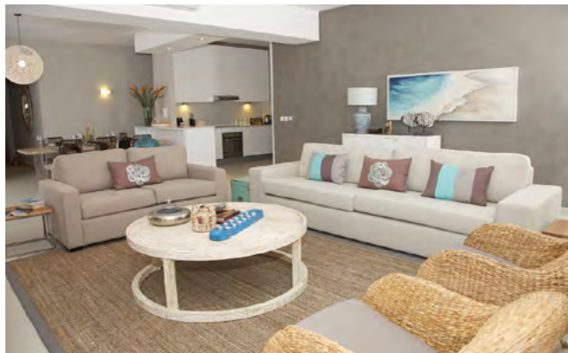
ELEMENT BAY BEACH