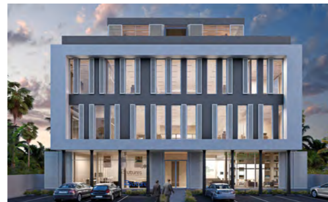
MCBQ - IQ