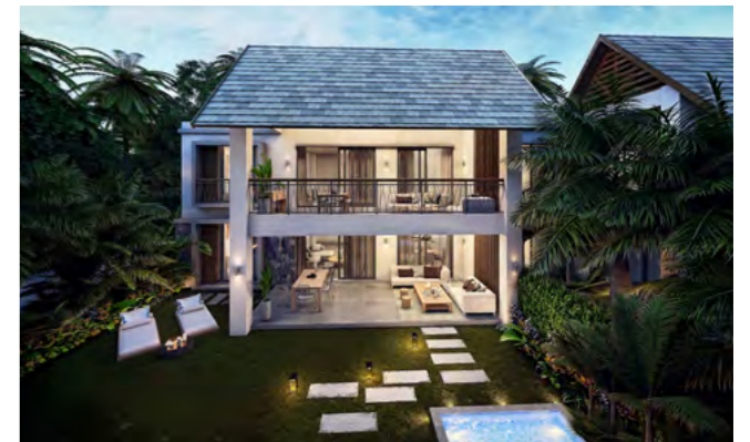
LE DOMAINE DE GRAND BAIE