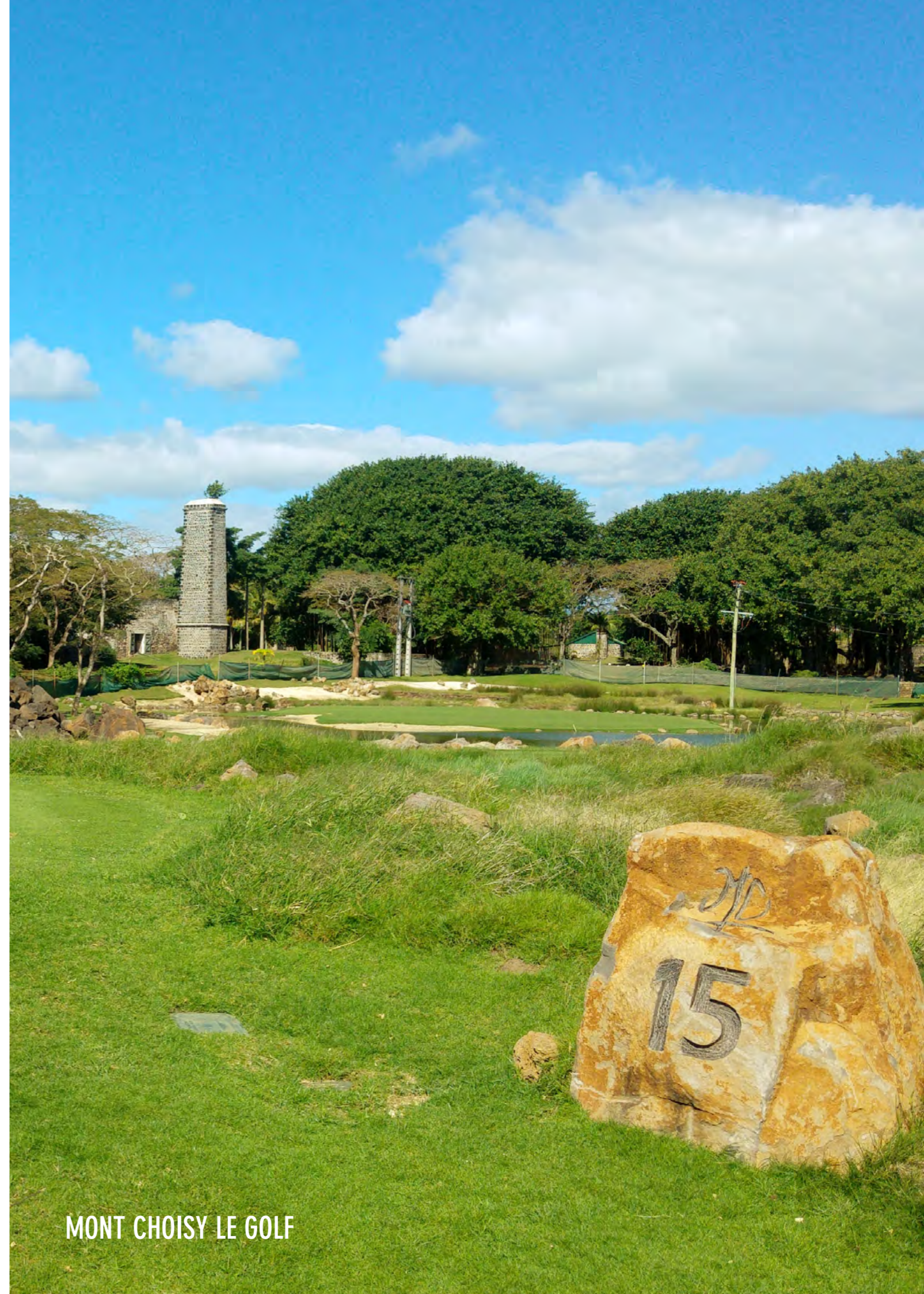
MONT CHOISY LE GOLF