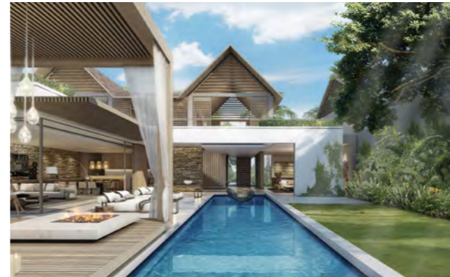
MONT CHOISY LE PARC