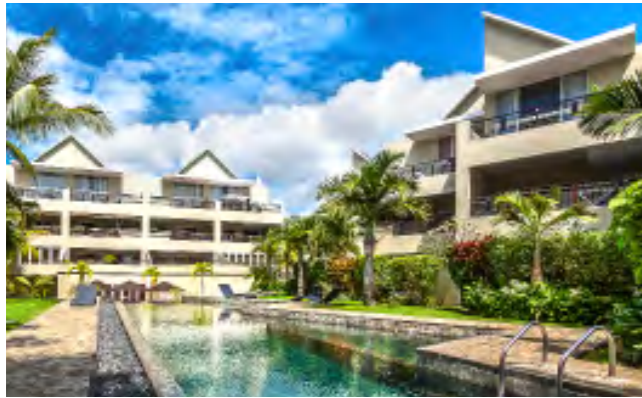
CAPE BAY BEACH RESORT

2Futures tient ses promesses et est fier de présenter ses projets livrés et ses développements en cours de réalisation.