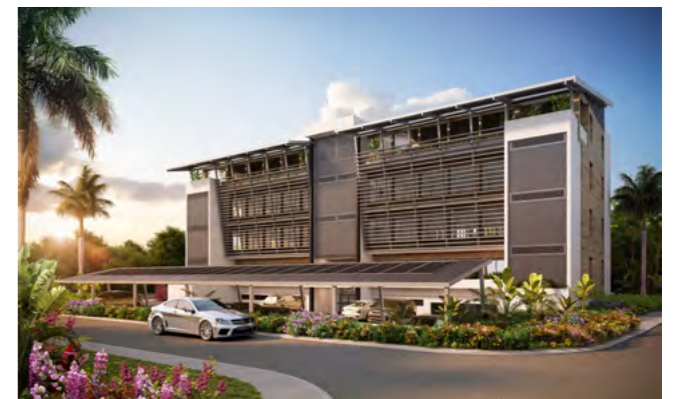
MCBQ - HQ